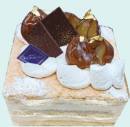
ジャージークリーム