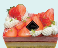
ピスタチオフレーズ