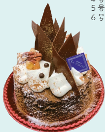
クラシックショコラ